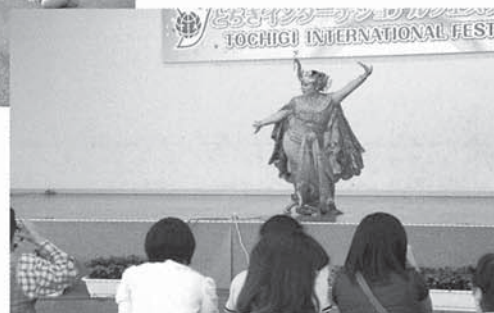
▼インドネシアの孔雀のような舞