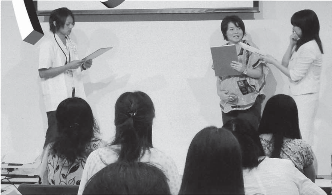
▲診察場面での通訳のデモンストレーション