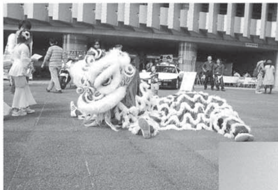
◀会場を練り歩いて、来場者を歓迎する中国の獅子舞