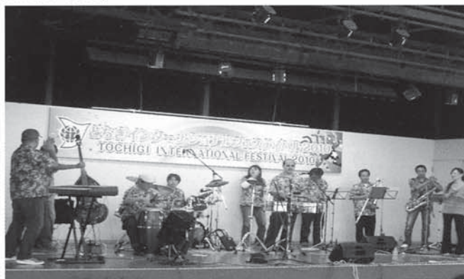
▲会場を魅了したオルケスタ・デ・ゴじゃる！の演奏