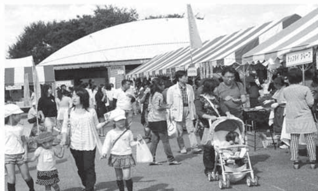
▲たくさんの方々にご来場いただきました。