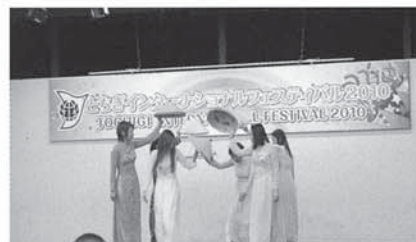
▲とちぎ国際ナショナルフェスティバル2010でベトナムの舞踊披露

ル2010」では、ベトナム料理の紹介ブースやベトナムの伝統衣装であるアオザイを着て、ステージで私たちグループの会員がベトナムの踊りを披露させていただきました。初めての