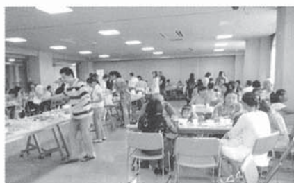
▲8月に開催した日本とベトナムの交流会