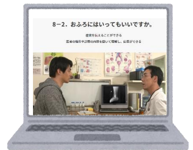
ぶんかちょうにほんごがくしゅう 文化庁日本語学習サイト