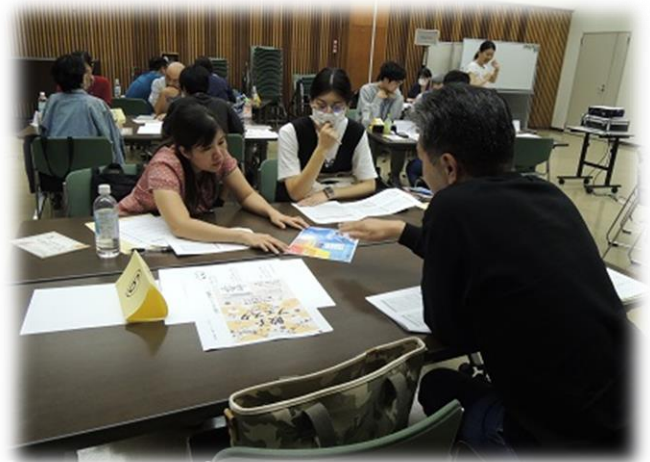
外国人に「やさしい日本語」で話す体験(昨年度のセミナー)

「やさしい日本語」を広めるため、ご参加のみなさん全員に「やさしい日本語」のハンドブックと缶バッジをお渡します!