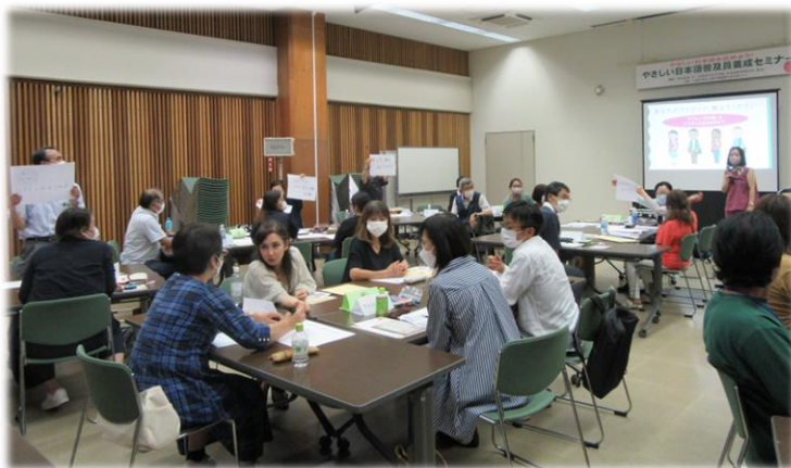
昨年度の外国人との実践ワーク