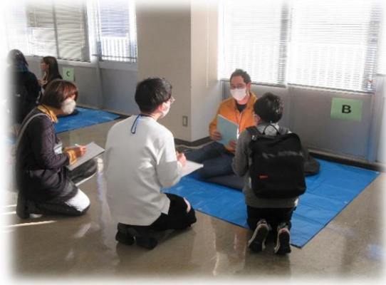
避難所巡回体験の様子