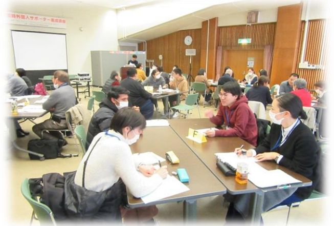
昨年度のサポーター養成講座