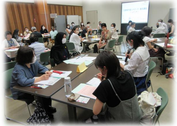
昨年度のサポーター養成講座

※外国人被災者への聞き取り訓練は、基本的に「やさしい日本語」(ゆっくり、簡単な言い方)で行います。