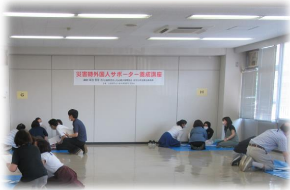
聞き取り訓練の様子