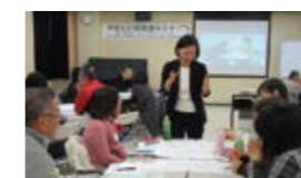
▲セミナーの様子 Aspetto ng Seminar