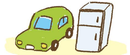
Automóveis e outros eletrodomésticos