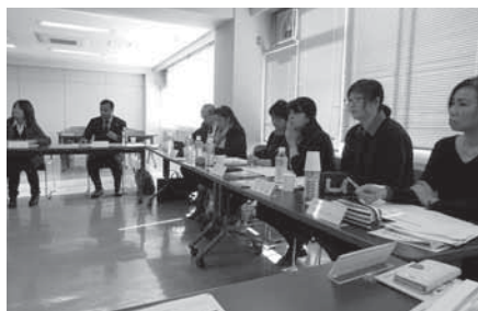
▲活発に発言するキーパーソンの皆さん

会議では、外国人キーパーソンと連携しての情報伝達の流れや外国人住民が利用するSNSの種類を確認、栃木県内での防災等の取り組みの紹介を行ったほか、外国人キーパーソンからそれぞれの出身国における防災意識や災害時の対応について発表してもらいました。避難所や防災訓練の有無、災害の種類や防災の意識など国ごとに違っている点が多く、今後の外国人住民への情報提供に大変参考になりました。