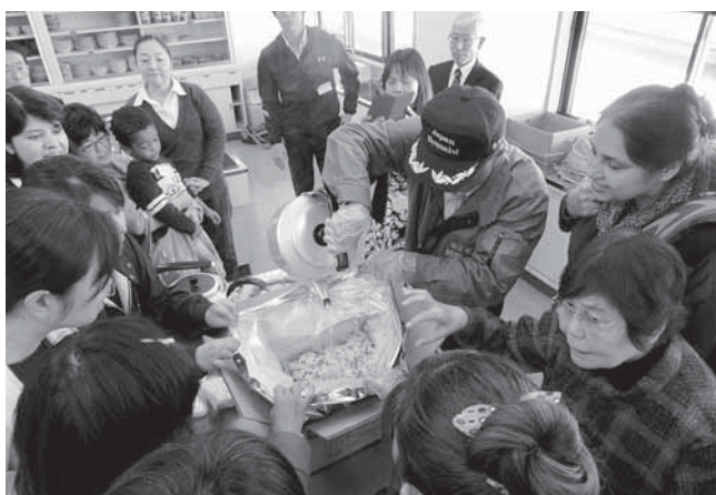
▲非常食の作り方の見学