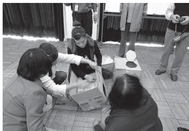
▲段ボールを使ったトイレ作りを体験