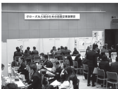
▲各ブースで説明を受ける参加者