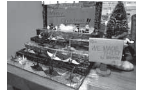
▲ステキになったTIAの受付