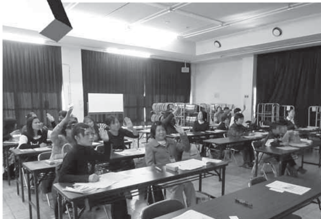
▲防災〇×クイズに答える参加者の皆さん