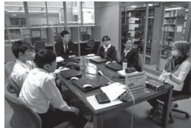
▲県国際交流員に質問する生徒たち