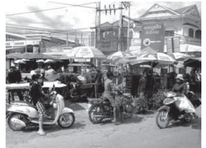
▲プノンペン市内のマーケット周辺の様子

カンボジアは内戦の深い傷跡がまだ残っています。受け継がれるべき伝統や教育が失われ、地雷が残っている地域もありますが協力隊の努力や ODA 事業の成果が確実に表れていることが実感できました。発展途上の中でも、大らかに明るく楽しそうに過ごしているカンボジアの人々や、至る所で見かける日本の国旗や親日家の存在は懸命な支援の賜物です。