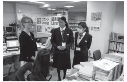
▲TIA職員とスペイン語での会話に挑戦

【2日目】外国人住民への情報発信のため、インターネットで情報収集し原稿を作成。その後、原稿を英語