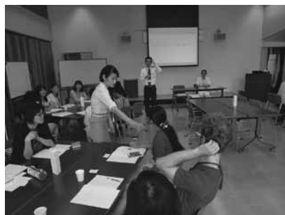
▲「職場でのマナーと会話」を学ぶ参加者

各回の前半は、就職スキルアップに重点を置き、「履歴書の書き方」や「面接の受け方」、「職場でのマナーと会話」などについて学びました。参加者はロールプレイングやグループワークを行い積極的に日本語で会話しました。後半は「業種紹介」としてレストラン、介護、工場、スーパーマーケット、国際業務などの関係者から業務内容の説明を受けたり、また、実際に働いている外国人