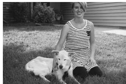
▲実家の前で愛犬ベイリーと

そうですね、流鏑馬や雪のかまくら祭りなど見てみたいです。また、日本国内でまだ行ったことのない東北や九州などを観光したいし、他のアジアの国々にも行きたいです。ほかには、男女平等など人権に関するテーマを通して世界や日本について考えるような機会を提供できればと思っています。