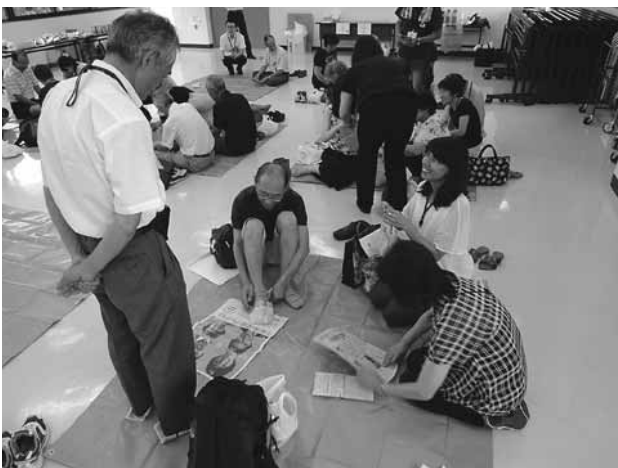
▲新聞紙でスリッパ作りをする参加者