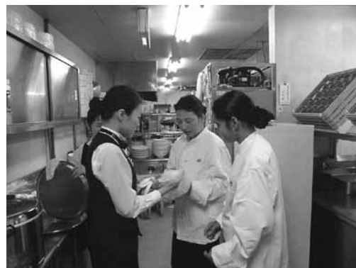
▲レストランで職場体験する参加者

就職支援セミナーの参加者を対象に、職場体験プログラムを実施しました。仕事現場を実際に体験することで、自分がやりたい仕事を見つけることを目的