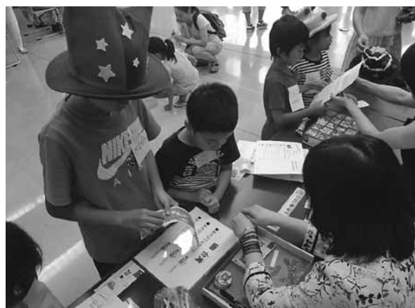
▲各ブースで現地の通貨で買い物する参加者(世界でおかいものツアー！)

食」(8/8)…タイ舞踊と衣装の紹介及びカノム・ドークの試食、⑩シャプラニールとちぎ架け橋の会「ほっこりかわいい！アジアの刺しゅう体験」(8/8)…バングラデシュの伝統刺しゅう「ノクシカタ」の体験、⑪交流会「仲間」「ネパールのおやつ・モモを作ろう！」(8/22)…モモの調理と試食、⑫オール・グローバルセミナーグループ“ハロハロ”「世界でおかいものツアー！」(8/22)…小学生が10か国のブースで買い物、⑬TIA&JICA筑波「ユーラシア・南米大陸横断！自転車地球旅行記！」(8/29)…自転車で大陸を横断した遠藤氏の体験談。⑭栃木県青年海外協力隊OB会「世界の果てまでいって来たY0！」(8/29)…元青年海外協力隊員がベネズエラとザンビアを紹介。