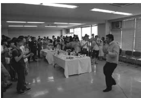
▲自身の作詞作曲の歌でパーティーを盛り上げるネパール留学生

ガイダンスでは、パワーポイントやビデオなどで栃木県の概要、TIAの事業紹介を行いました。県内大学の先輩留学生3名によるパネルディス