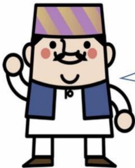
サンガサンガイ君

彼らの声に耳を傾け、日本とネパー ルの違いを感じながら、私たちができ ることを考えます。